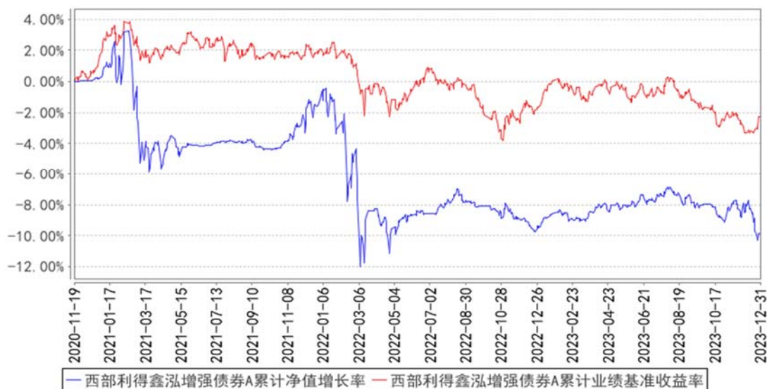
西部利得鑫泓增强债券A累计净值增长率与同期业绩比较基准收益率的历史走势对比图