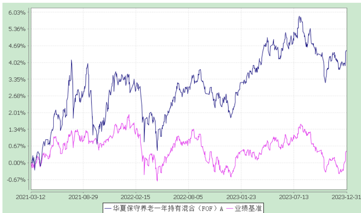
华夏保守养老一年持有混合（FOF）Y: