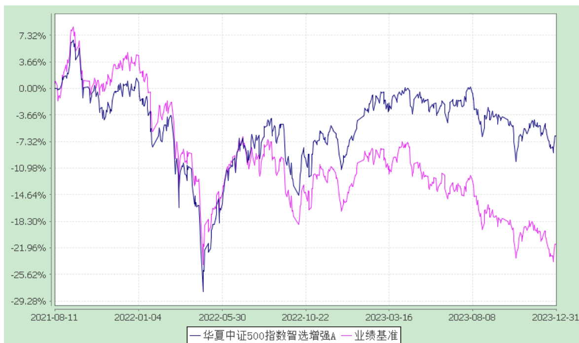
华夏中证 500 指数智选增强 C: