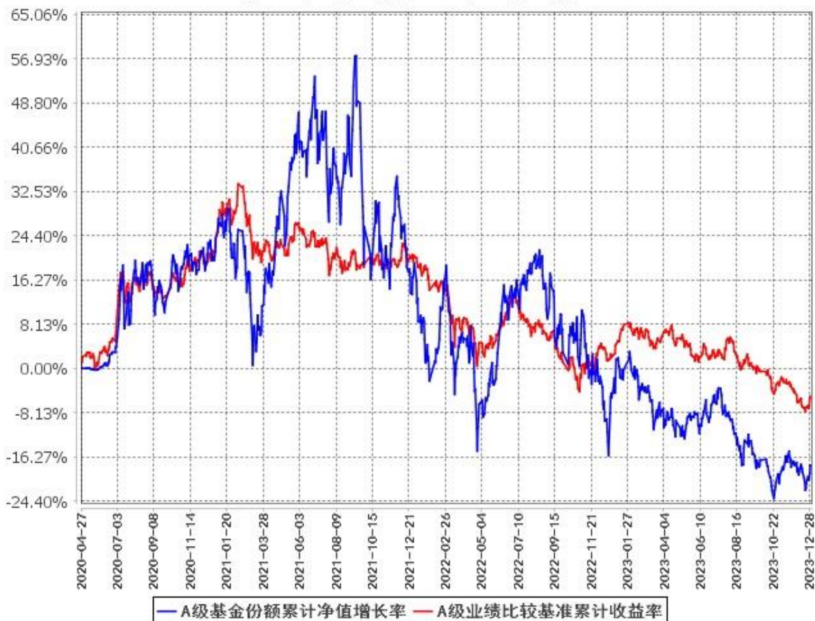
A级基金份额累计净值增长率与同期业绩比较基准收益率的历史走势对比图 (2020年4月27日至2023年12月31日)