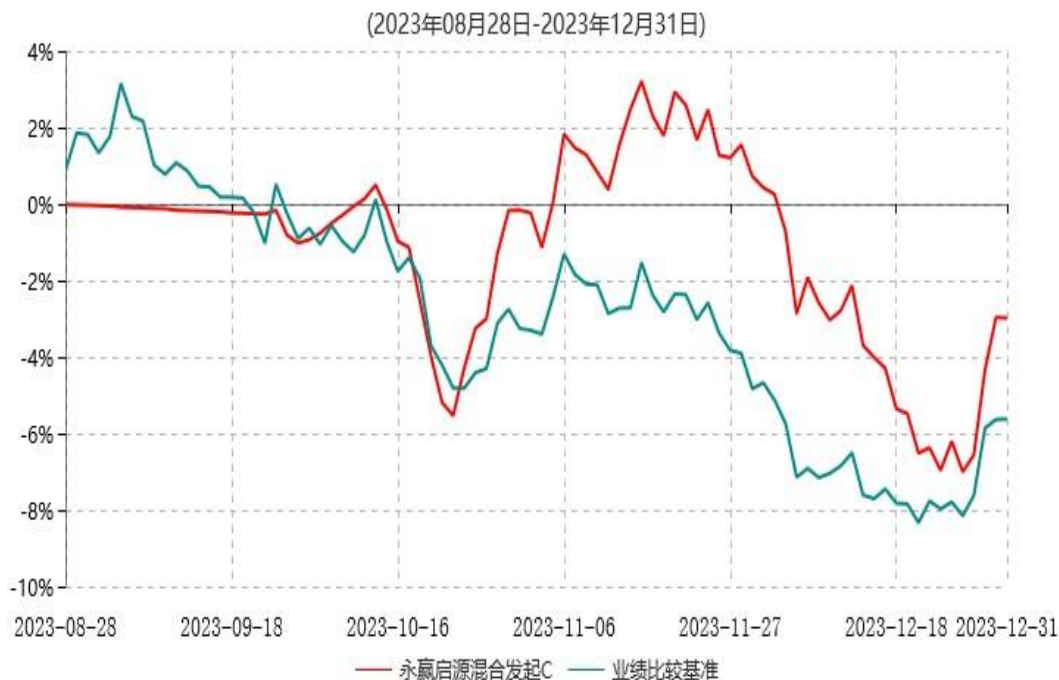
永赢启源混合发起C累计净值增长率与业绩比较基准收益率历史走势对比图