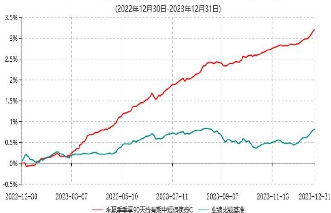
永赢季季享90天持有期中短债债券C累计净值增长率与业绩比较基准收益率历史走势对比图