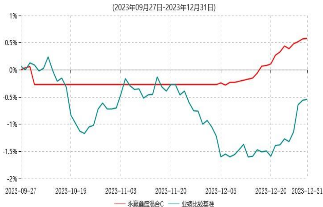
永赢鑫盛混合C累计净值增长率与业绩比较基准收益率历史走势对比图

注：本基金自 2023 年 09 月 27 日增设 C 类份额，截至本报告期末，本类基金份额生效未 满一年。