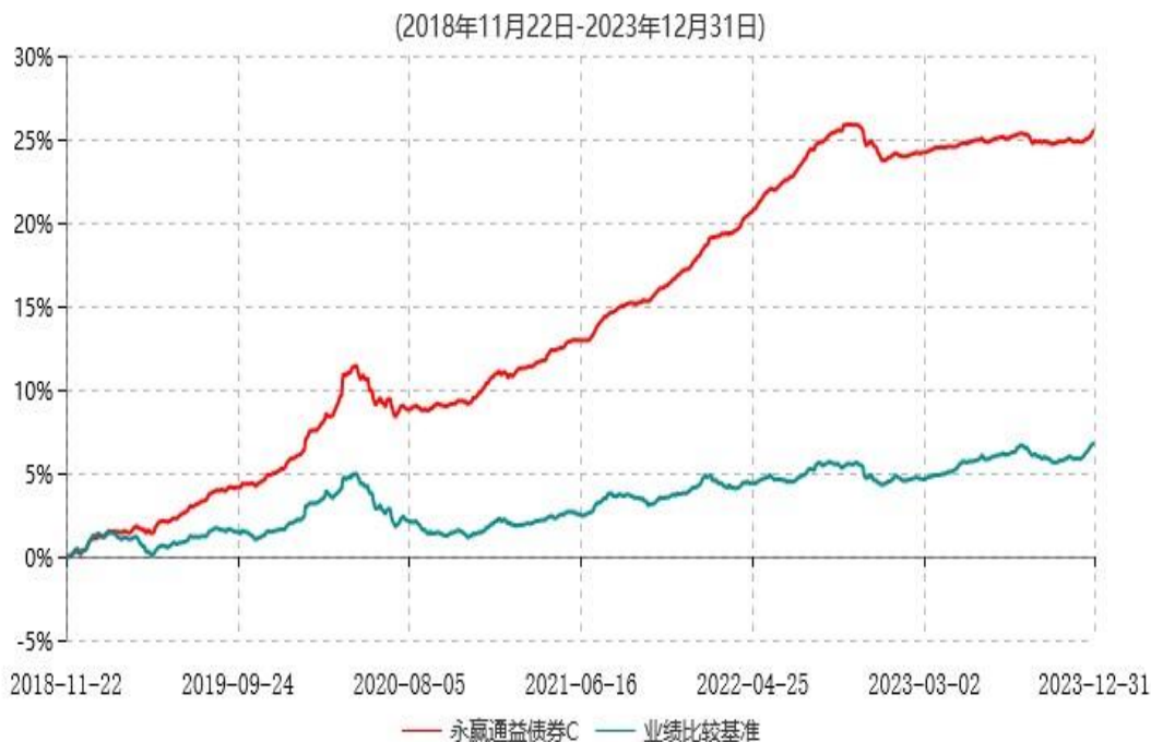
永赢通益债券C累计净值增长率与业绩比较基准收益率历史走势对比图