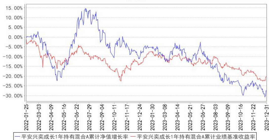
平安兴奕成长1年持有混合A累计净值增长率与同期业绩比较基准收益率的历史走势对比图