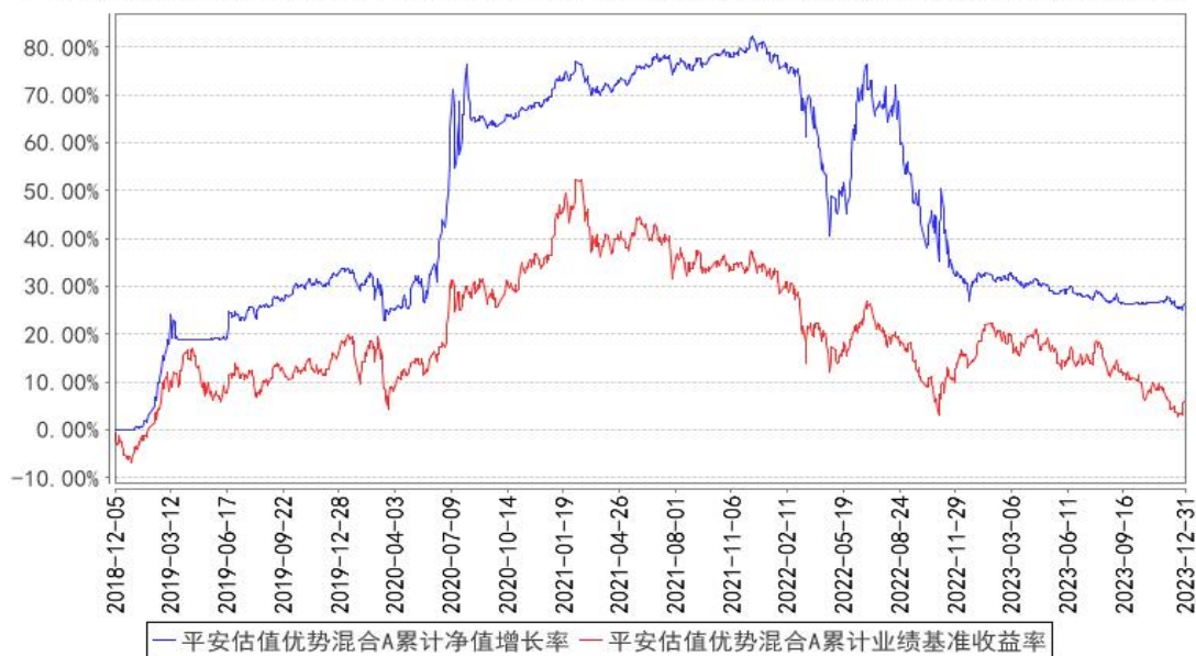
平安估值优势混合A累计净值增长率与同期业绩比较基准收益率的历史走势对比图