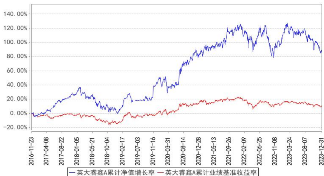
英大睿鑫A累计净值增长率与同期业绩比较基准收益率的历史走势对比图