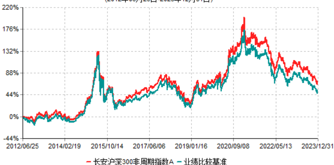
长安沪深300非周期指数A累计净值增长率与业绩比较基准收益率历史走势对比图 (2012年06月25日-2023年12月31日)

根据基金合同的规定,自基金合同生效之日起6个月内基金各项资产配置比例需符合基金合同要求。本基金在建仓期结束后,各项资产配置比例已符合基金合同有关投资比例