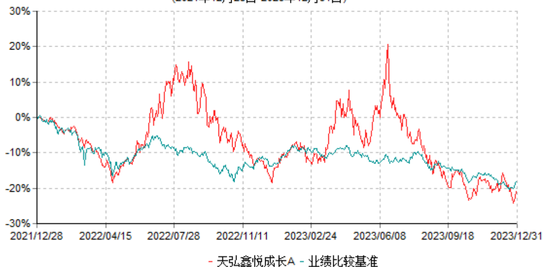
天弘鑫悦成长A累计净值增长率与业绩比较基准收益率历史走势对比图 (2021年12月28日-2023年12月31日)