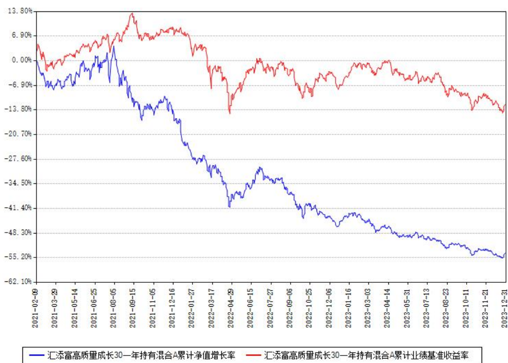
汇添富高质量成长30一年持有混合A累计净值增长率与同期业绩比较基准收益率对比图