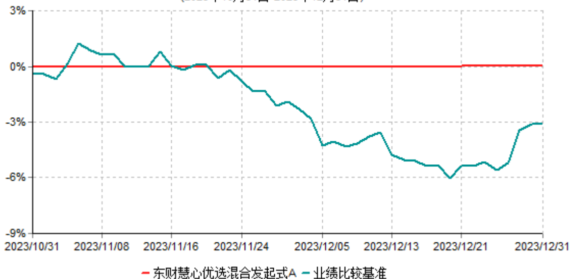
东财慧心优选混合发起式A累计净值增长率与业绩比较基准收益率历史走势对比图 (2023年10月31日-2023年12月31日)