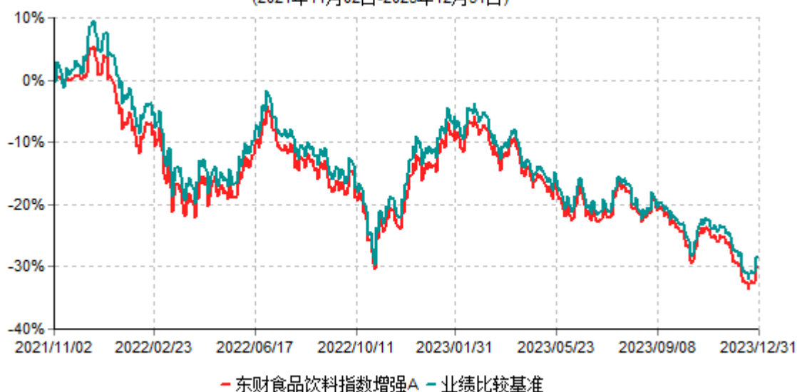
东财食品饮料指数增强A累计净值增长率与业绩比较基准收益率历史走势对比图 (2021年11月02日-2023年12月31日)