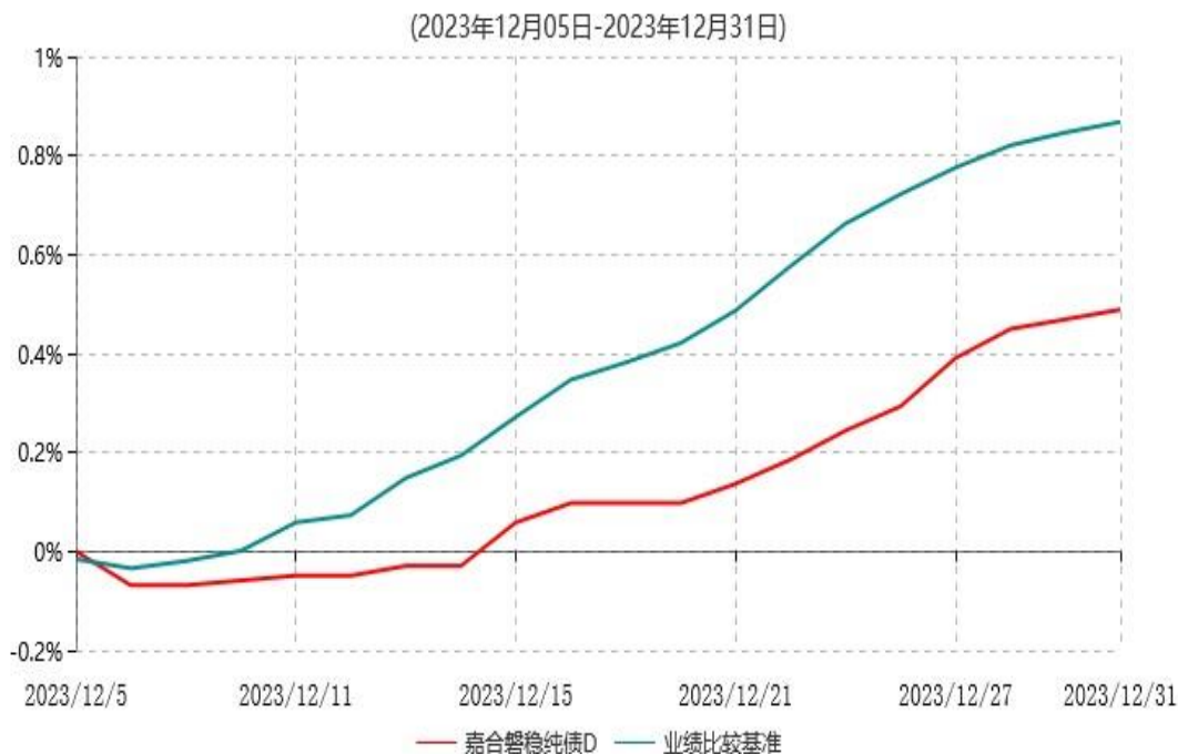
嘉合磐稳纯债D累计净值增长率与业绩比较基准收益率历史走势对比图

注：本基金于 2023 年 12 月 05 日增设 D 类基金份额，D 类基金份额实际存续从 2023 年 12 月 05 日开始。