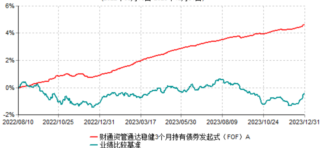
财通资管通达稳健3个月持有债券发起式（FOF）A累计净值增长率与业绩比较基准收益率历史走势对比图 (2022年08月10日-2023年12月31日)