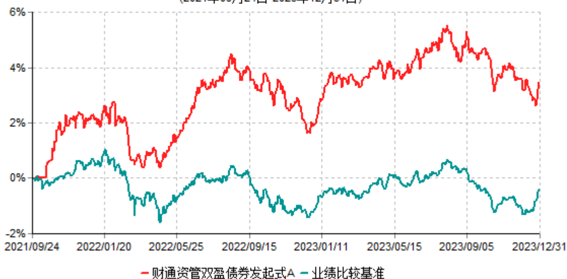
财通资管双盈债券发起式A累计净值增长率与业绩比较基准收益率历史走势对比图 (2021年09月24日-2023年12月31日)