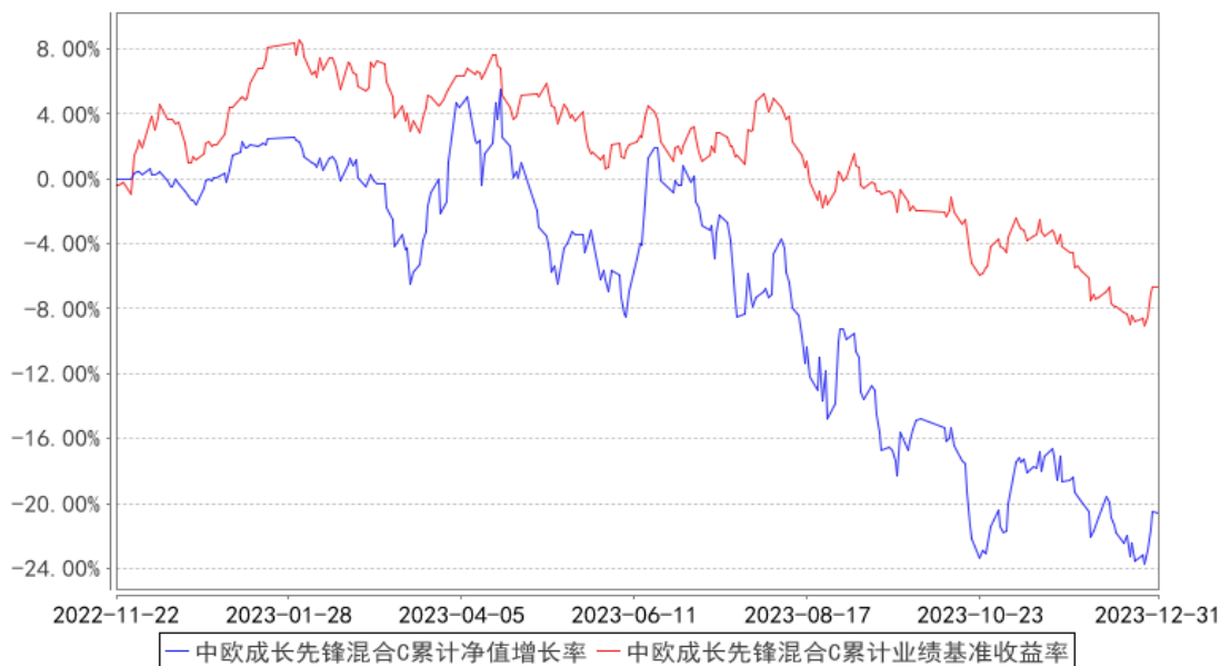
中欧成长先锋混合C累计净值增长率与同期业绩比较基准收益率的历史走势对比图

注：本基金基金合同生效日期为 2022 年 11 月 22 日，按基金合同的规定，本基金自基金合同生效起六个月为建仓期，建仓期结束时各项资产配置比例已经符合基金合同约定。