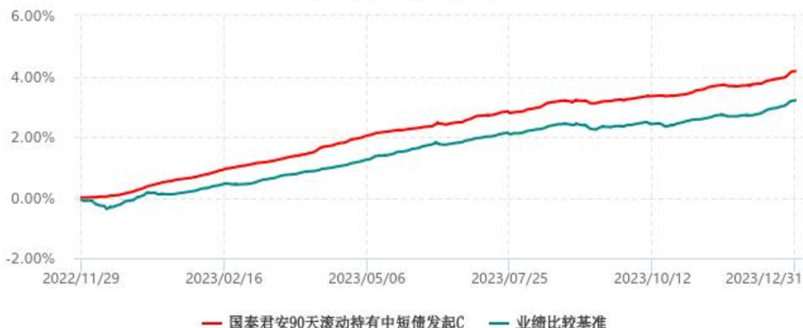
国泰君安90天滚动持有中短债发起C累计净值增长率与业绩比较基准收益率历史走势对比图 (2022年11月29日-2023年12月31日)

注：按基金合同和招募说明书的约定，本基金的建仓期为六个月，建仓期结束时各项资产配置比例符合基金合同的有关约定。