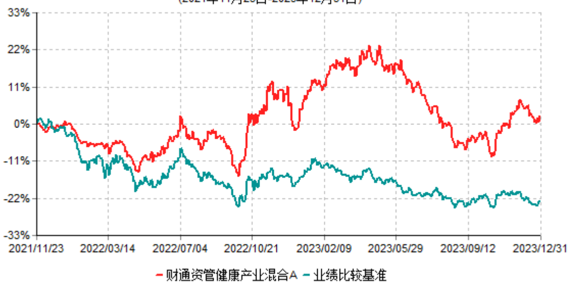
财通资管健康产业混合A累计净值增长率与业绩比较基准收益率历史走势对比图 (2021年11月23日-2023年12月31日)