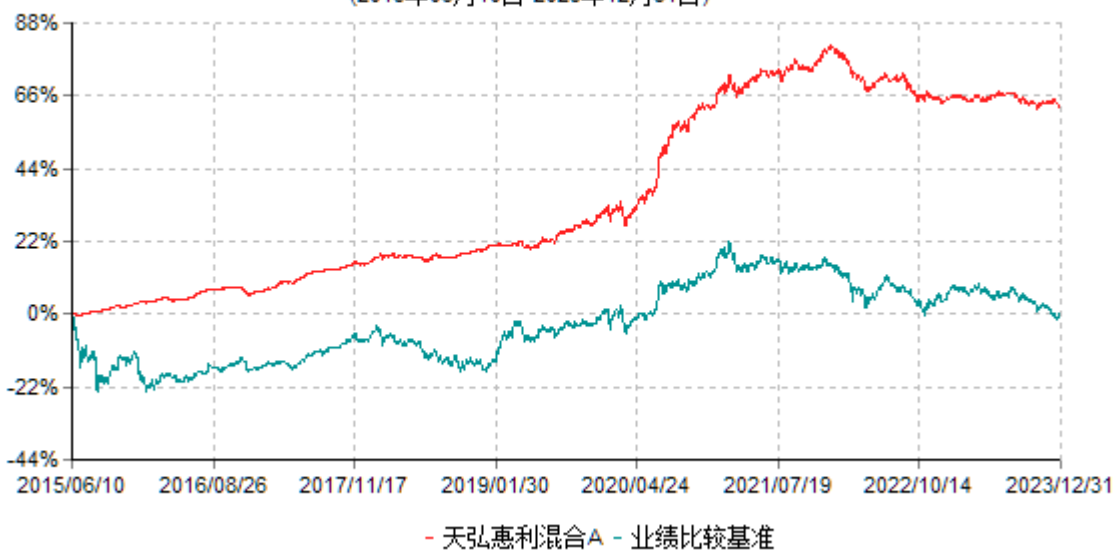
天弘惠利混合A累计净值增长率与业绩比较基准收益率历史走势对比图 (2015年06月10日-2023年12月31日)