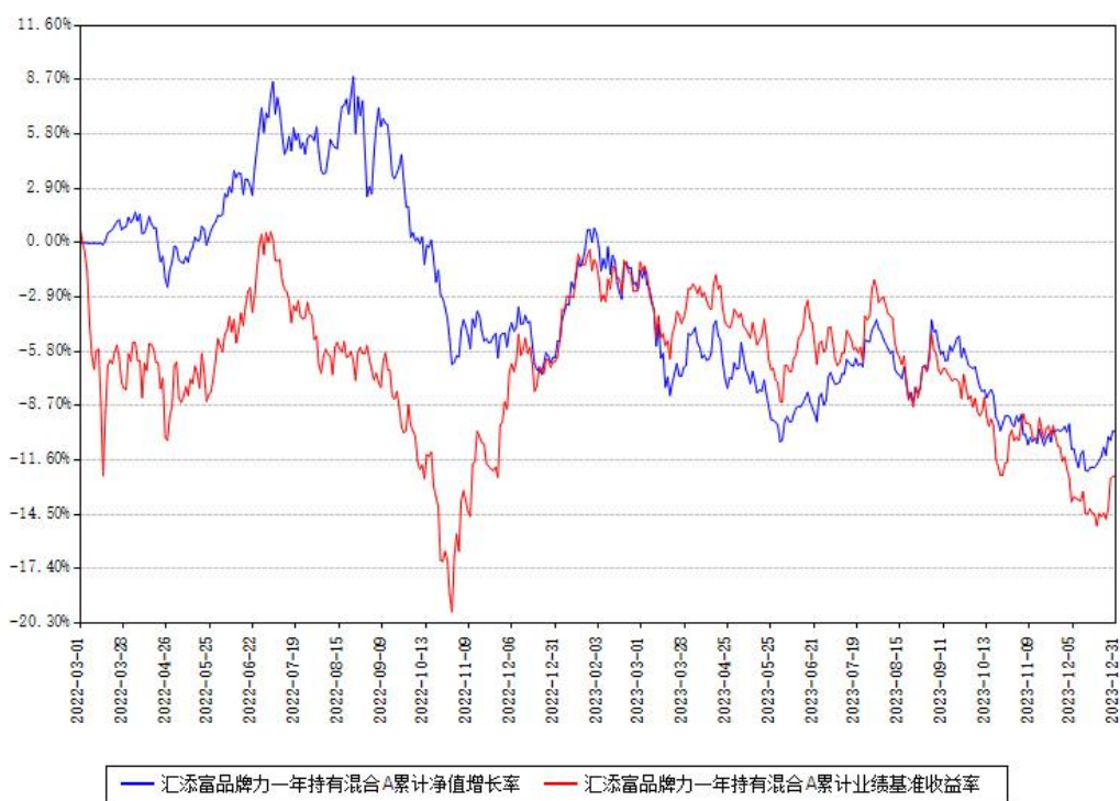
汇添富品牌力一年持有混合A累计净值增长率与同期业绩比较基准收益率对比图