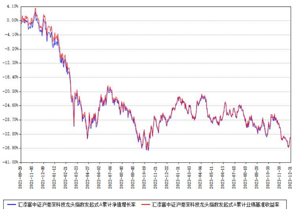
汇添富中证沪港深科技龙头指数发起式A累计净值增长率与同期业绩比较基准收益率对比图