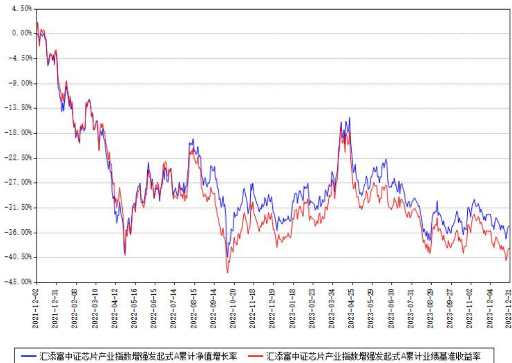
汇添富中证芯片产业指数增强发起式A累计净值增长率与同期业绩基准收益率对比图