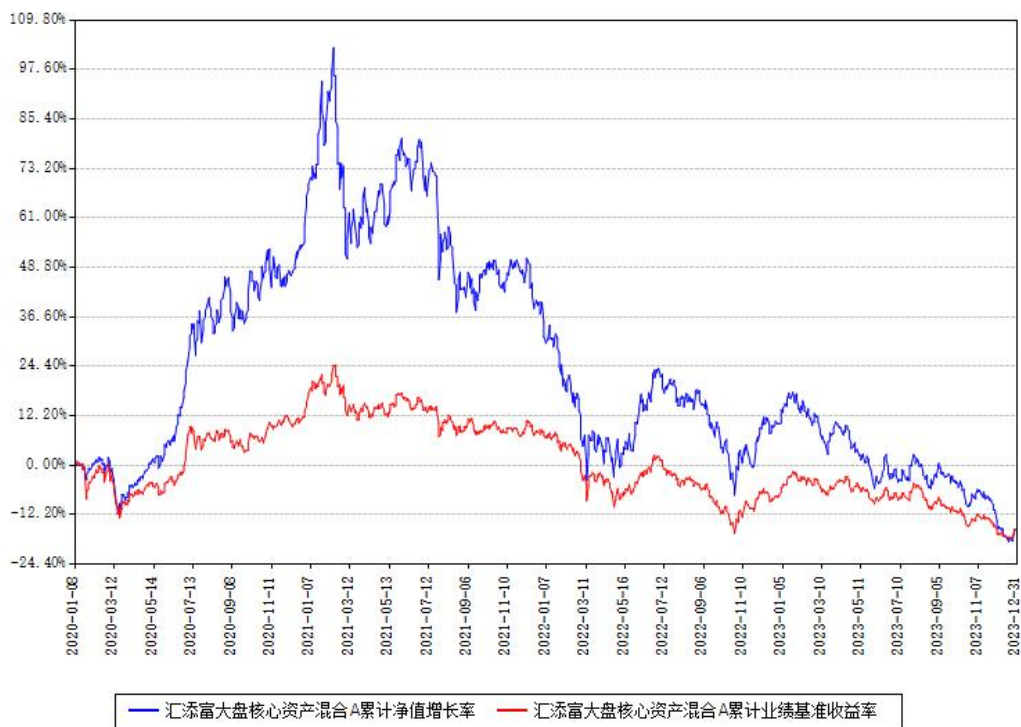
汇添富大盘核心资产混合A累计净值增长率与同期业绩比较基准收益率对比图