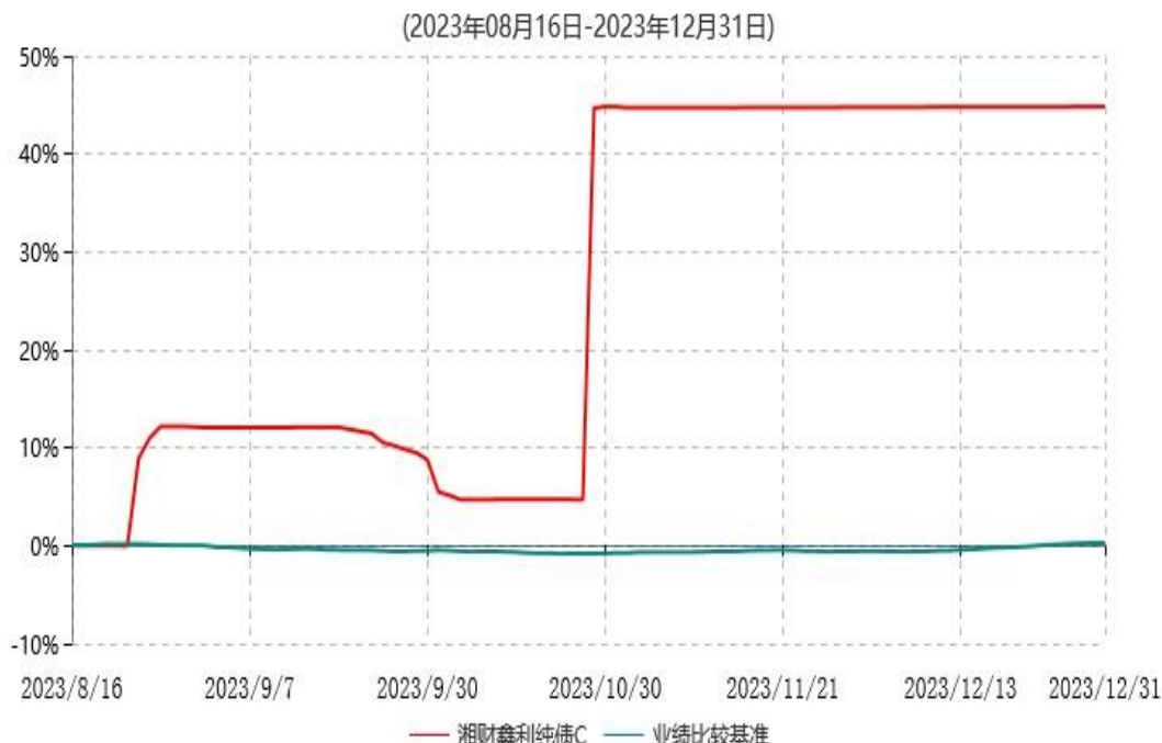
湘财鑫利纯债C累计净值增长率与业绩比较基准收益率历史走势对比图