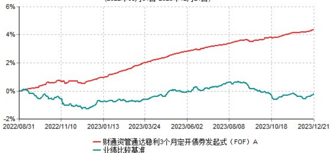
财通资管通达稳利3个月定开债券发起式（FOF）A累计净值增长率与业绩比较基准收益率历史走势对比图 (2022年08月31日-2023年12月21日)