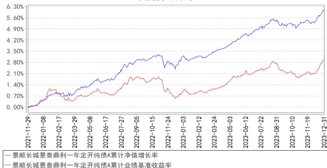
景顺长城景泰鼎利一年定开纯债A累计净值增长率与同期业绩比较基准收益率的历史走势对比图