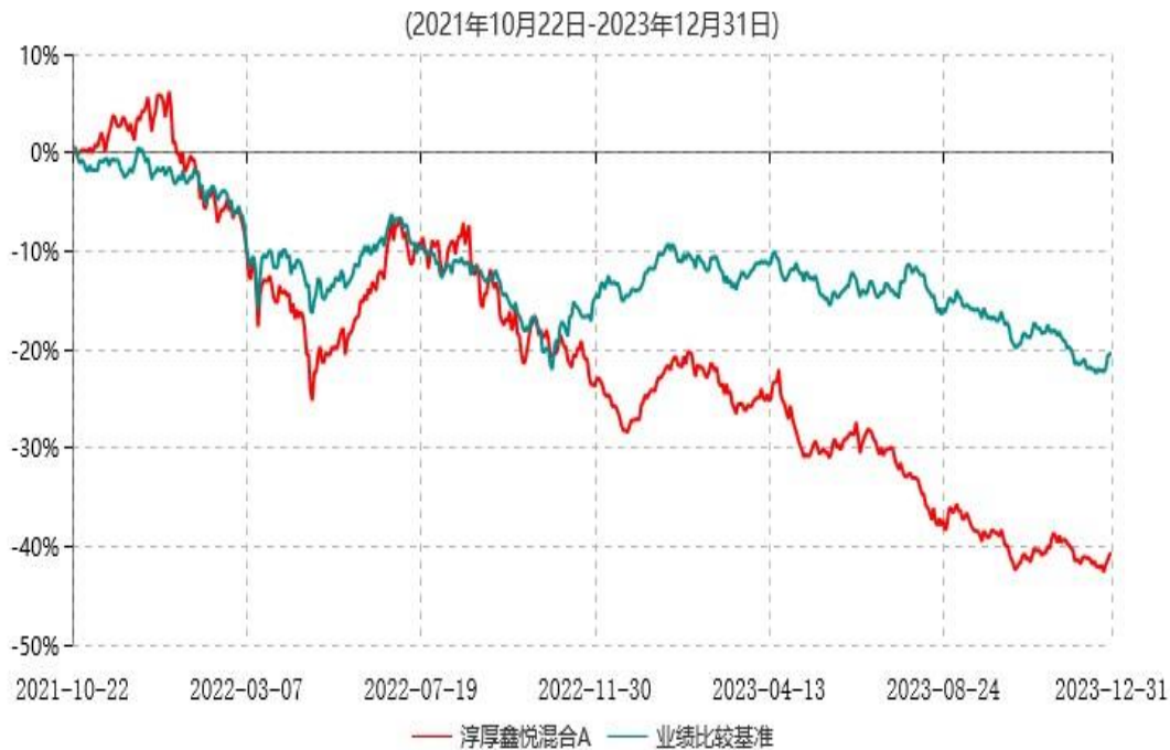
淳厚鑫悦混合A累计净值增长率与业绩比较基准收益率历史走势对比图

注：本基金基金合同生效日为 2021 年 10 月 22 日。按基金合同规定，本基金自基金合同生效起 6 个月内为建仓期。建仓期结束时本基金的各项投资比例均符合基金合同约定。