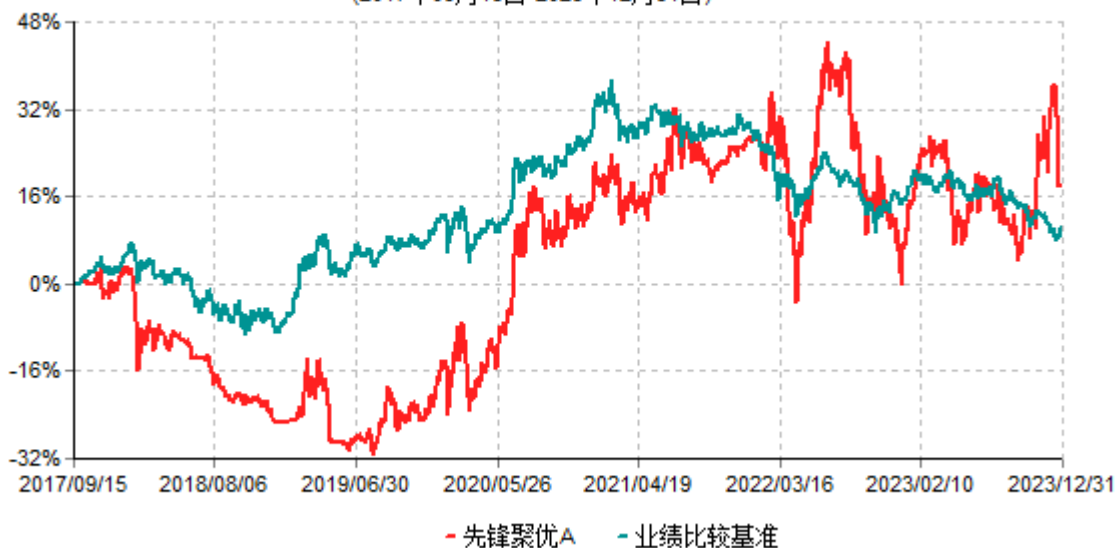
先锋聚优A累计净值增长率与业绩比较基准收益率历史走势对比图 (2017年09月15日-2023年12月31日)