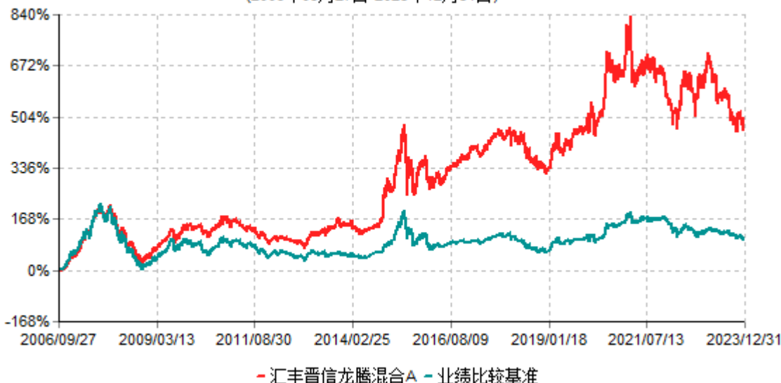
汇丰晋信龙腾混合A累计净值增长率与业绩比较基准收益率历史走势对比图 (2006年09月27日-2023年12月31日)