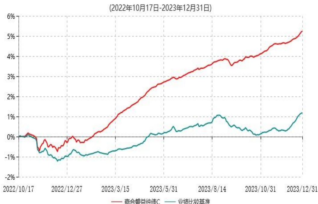
嘉合磐益纯债C累计净值增长率与业绩比较基准收益率历史走势对比图

注：本基金合同于 2022 年 10 月 17 日生效，按基金合同规定，本基金自合同生效起 6 个月内为建仓期。建仓期结束时，本基金的各项资产配置比例符合基金合同约定。