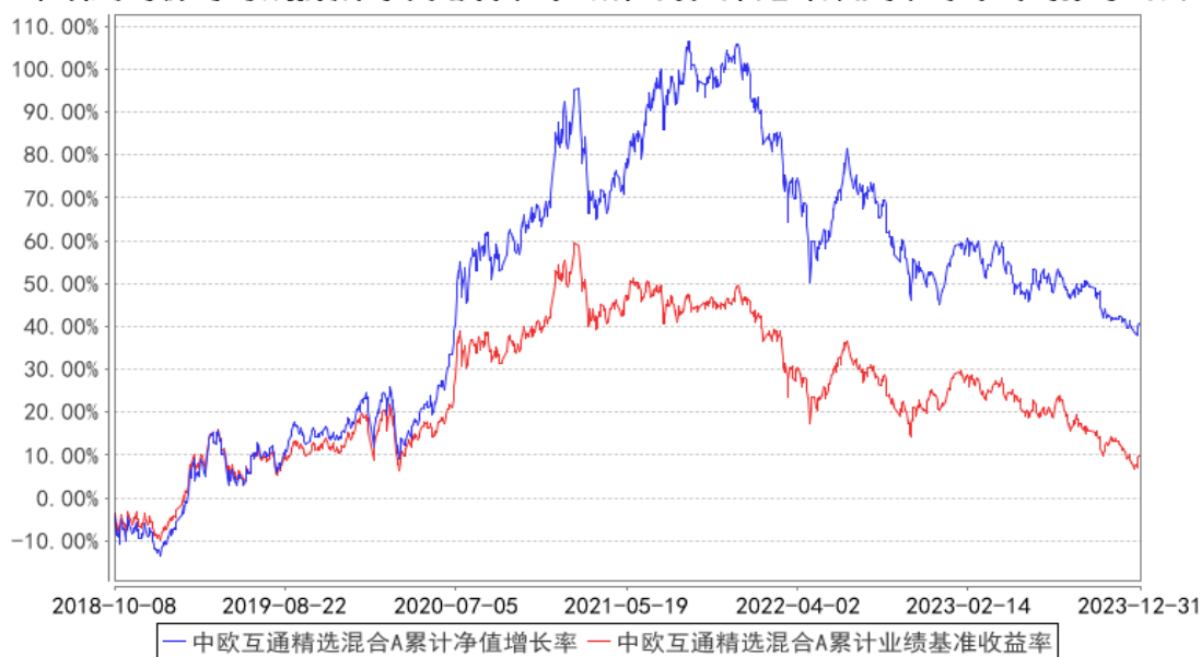
中欧互通精选混合A累计净值增长率与同期业绩比较基准收益率的历史走势对比图

注：自 2018 年 10 月 8 日起，原中欧沪深 300 指数增强型证券投资基金转型为中欧互通精选混合型证券投资基金。图示为 2018 年 10 月 8 日至 2023 年 12 月 31 日。