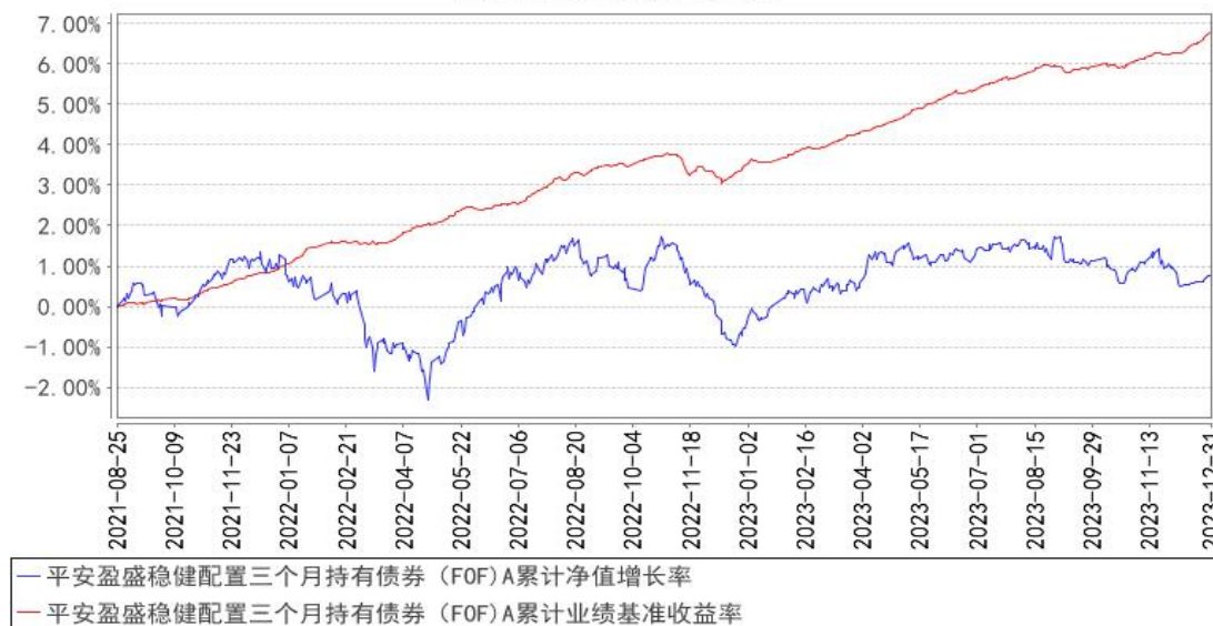
平安盈盛稳健配置三个月持有债券 (FOF) A 累计净值增长率与同期业绩比较基准收益率的历史走势对比图