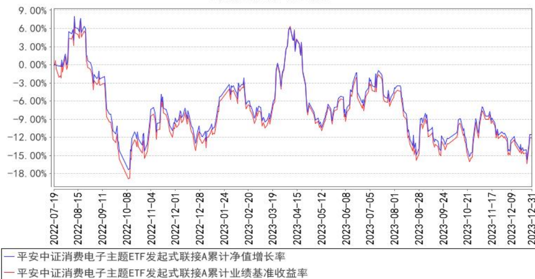
平安中证消费电子主题ETF发起式联接A累计净值增长率与同期业绩比较基准收益率的历史走势对比图