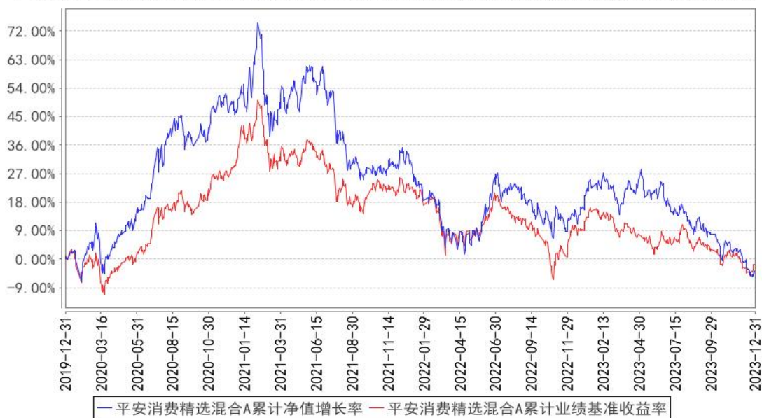
平安消费精选混合A累计净值增长率与同期业绩比较基准收益率的历史走势对比图