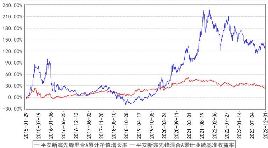
平安新鑫先锋混合A累计净值增长率与同期业绩比较基准收益率的历史走势对比图