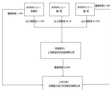
公司与实控人之间产权及控制关系的方框图