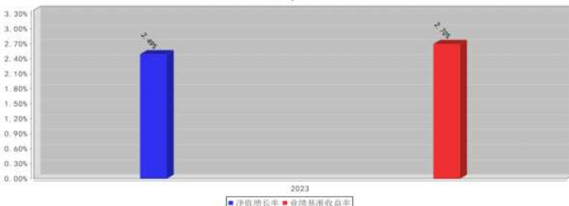
融通中证中诚信央企信用债指数C基金每年净值增长率与同期业绩比较基准收益率的对比图（2023年12月31日）

注：（1）基金的过往业绩不代表未来表现。 （2）合同生效当年不满完整自然年度的，按实际期限计算净值增长率。