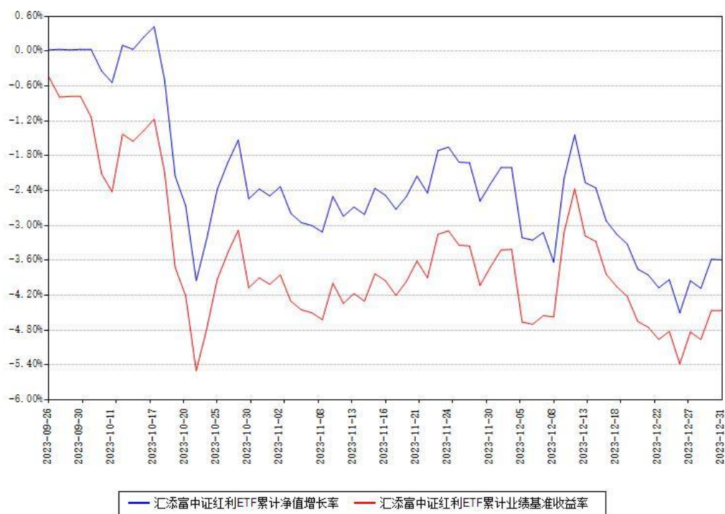
汇添富中证红利ETF累计净值增长率与同期业绩基准收益率对比图