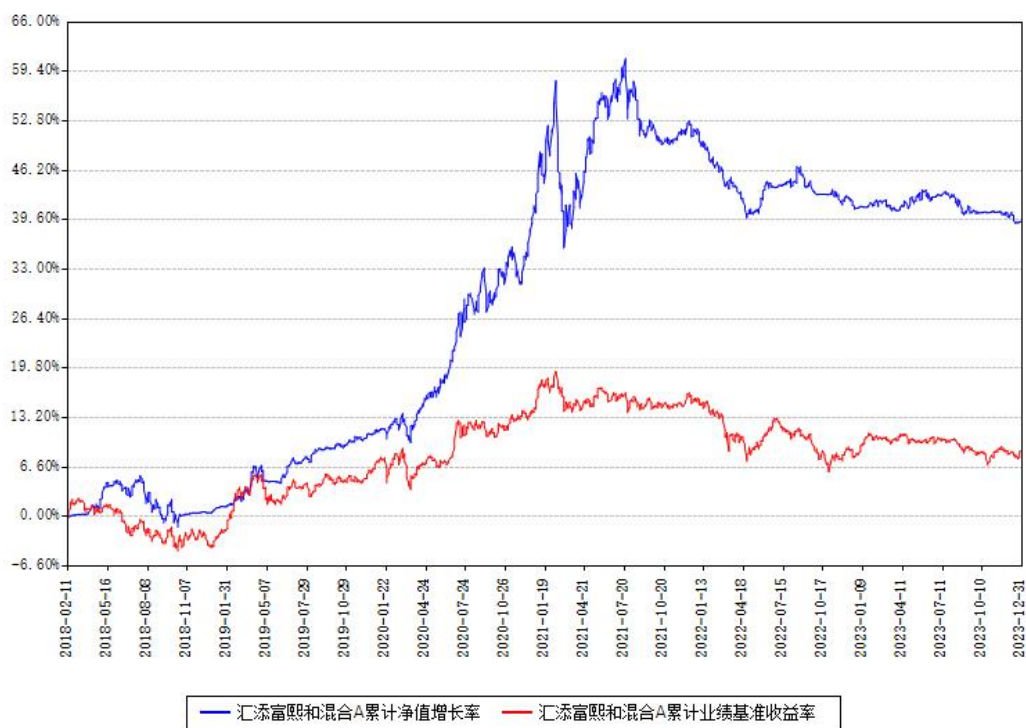
汇添富熙和混合A累计净值增长率与同期业绩基准收益率对比图