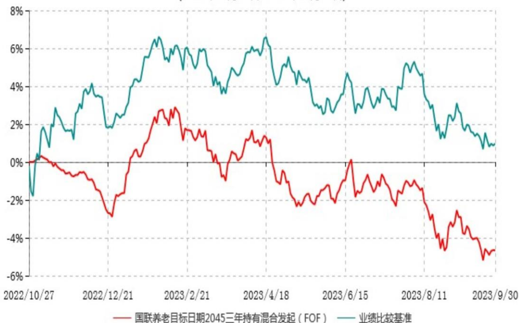
国联养老目标日期2045三年持有期混合型发起式基金中基金 (FOF) 累计净值增长率与业绩比较基准收益率历史走势对比图 (2022年10月27日-2023年09月30日)