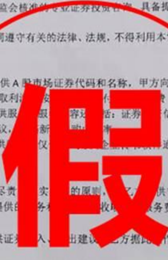
(上图：虚假“证券投资咨询服务协议”)

第一条、甲方向乙方提供具体证券买入、卖出建议，乙方据此操作获取利润后按照月收益的20%向甲方支付咨询服务费。 第二条、乙方据此操作，甲方补偿乙方亏损金额的100%，每次操作乙方必须截图股