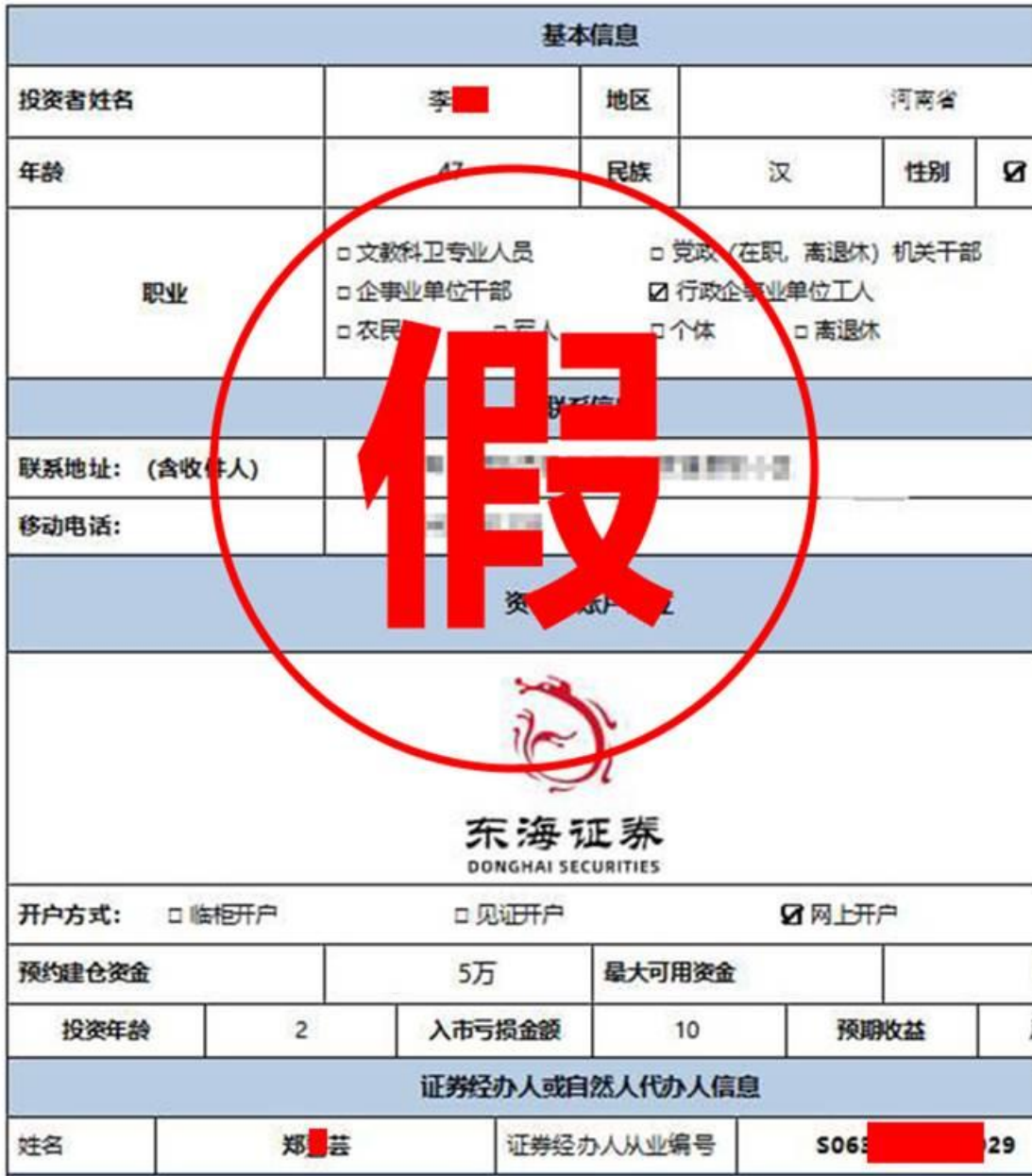
（上图：虚假“东海证券资管子账户开户申请表”）