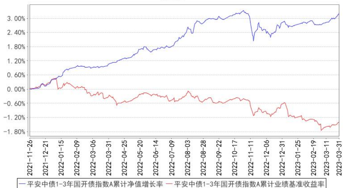
平安中债1-3年国开债指数A累计净值增长率与同期业绩比较基准收益率的历史走势对比图