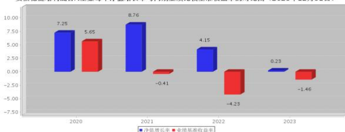
安信稳健增利混合A基金每年净值增长率与同期业绩比较基准收益率的对比图（2023年12月31日）

注：基金合同生效当年期间的相关数据按实际存续期计算。基金的过往业绩并不代表其未来表现。