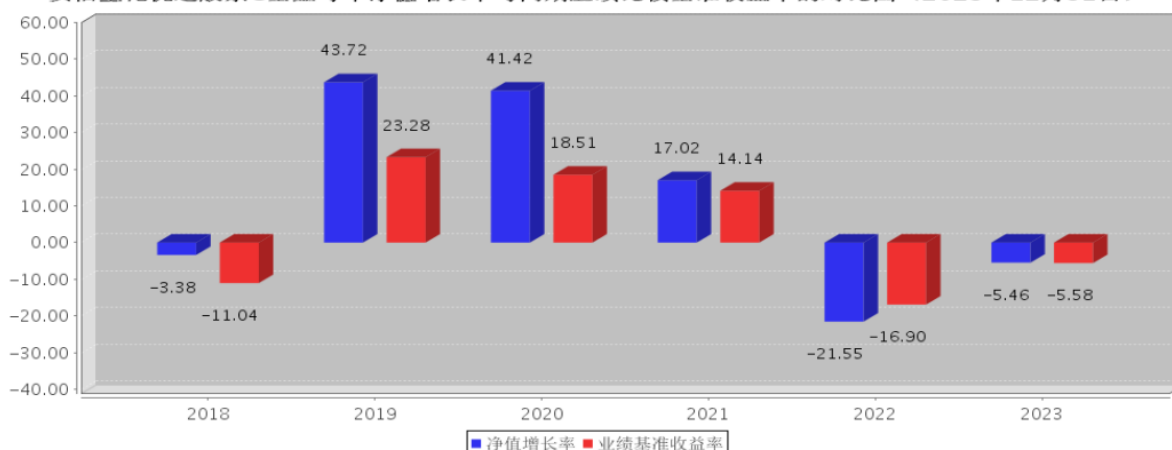
安信量化优选股票C基金每年净值增长率与同期业绩比较基准收益率的对比图（2023年12月31日）

注：基金合同生效当年期间的相关数据按实际存续期计算。基金的过往业绩并不代表其未来表现。