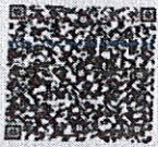
林伟的年检二维码

本证书经检验合格，继续有效一年。 This certificate is valid for another year after this renewal.