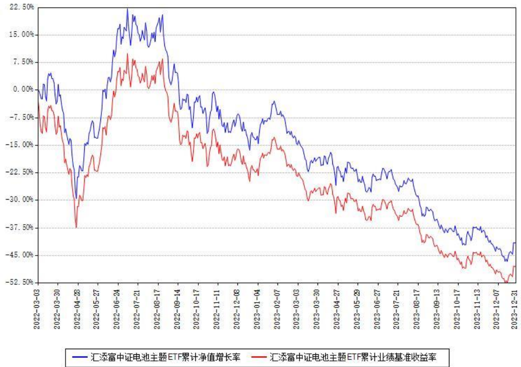
汇添富中证电池主题ETF累计净值增长率与同期业绩基准收益率对比图